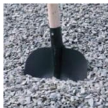
Drčené kamenivo 8 - 16