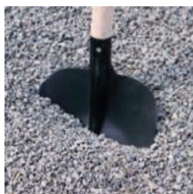
Drčené kamenivo 4 - 8 (prané)

vhodné jako podlaží pro zámkové dlažby, cesty