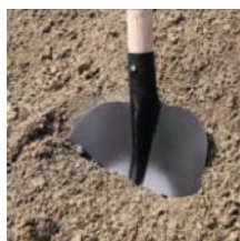
Přírodní těžžený písek 0 - 22