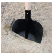
Přírodní těžžený písek 0 - 4