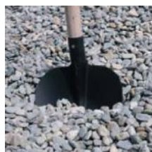
Těžžené kamenivo 16 - 22