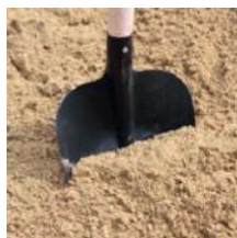
Přírodní kopaný písek 0 - 4