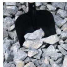
Drčené kamenivo 32 - 63