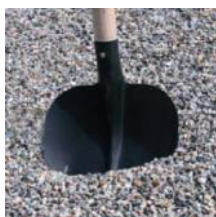
Těžžené kamenivo 4 - 8