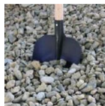
Těžžené kamenivo 16 - 45