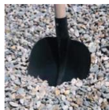
Těžžené kamenivo 8 - 16